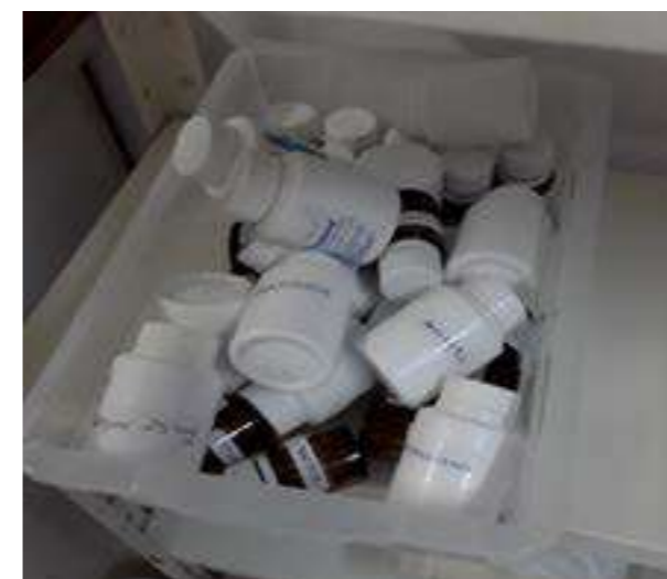
Medicamentos devolvidos (recusados pelos pacientes ou não administrados).

Outra situação é quando os pacientes se recusam a tomar os medicamentos. Eles são realocados em embalagens diversas, identificadas apenas com o nome do medicamento ou substância, sem dosagem específica, validade ou lote, para posteriormente serem administrados para outros pacientes, não é possível se certificar qual medicamento está sendo devolvido, ou seja, a identificação fica comprometida. A separação é feita de forma visual, por semelhança entre os comprimidos (cor, forma e tamanho).