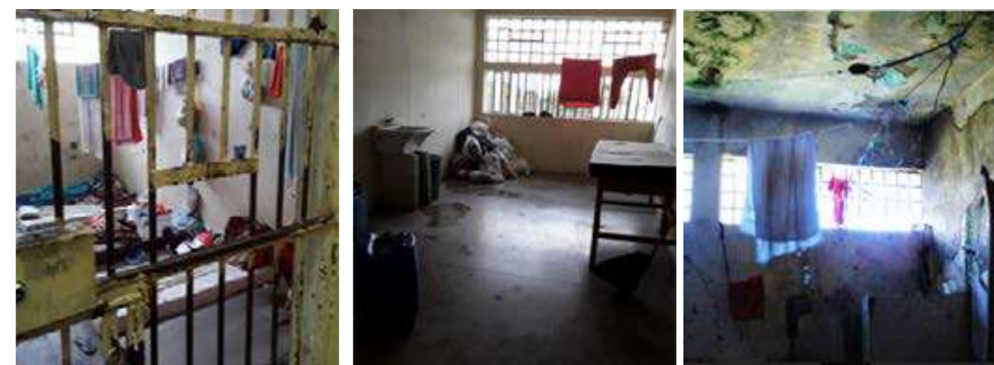
Condições precárias de assistência à saúde dos encarcerados.

Em nota, a Defensoria Pública do Paraná (DPE-PR), por meio do Núcleo de Política Criminal e Execução Penal (Nupep), afirmou que o CMP estava sob indicativo de interdição em razão do déficit de profissionais da área de saúde na unidade. Além disso, o Nupep afirma ainda que, segundo os artigos 10 e 14 da Lei de Execução Penal, é direito dos apenados e presos provisórios, a assistência à saúde em caráter preventivo e curativo, que abrange atendimento médico, farmacêutico e odontológico.