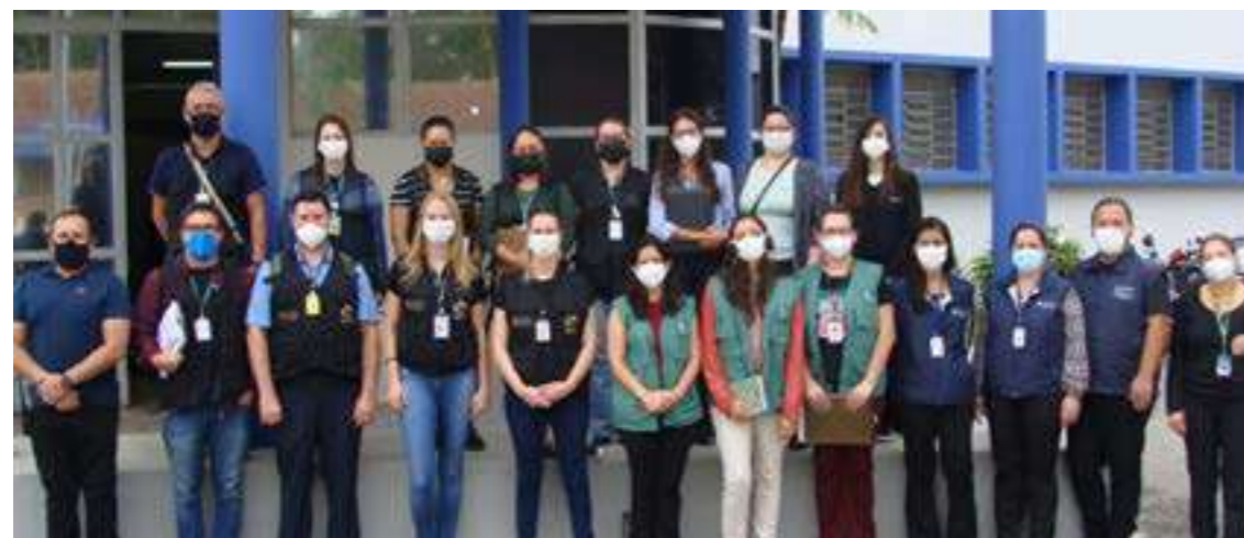
Operação conjunta: representantes das entidades que participam da inspeção no CMPP.

Imediatamente à inspeção, o CRM-PR determinou a interdição ética do Complexo Médico Penal, em Pinhais, Região Metropolitana de Curitiba (RMC). Com a medida, aprovada em sessão plenária do CRM, foram impedidas as entradas de novos presos na unidade até que as medidas necessárias fossem tomadas pelas autoridades competentes para normalizar os atendimentos.